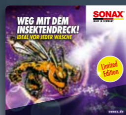
TOPPER INSEKTENTFERNER ART.-NR. 01223980