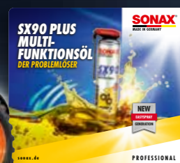
TOPPER SX90 ART.-NR. 02156980