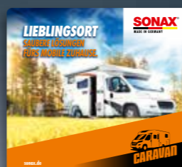
TOPPER CARAVAN ART.-NR. 02368980