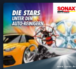
TOPPER STARS ART.-NR. 02216980