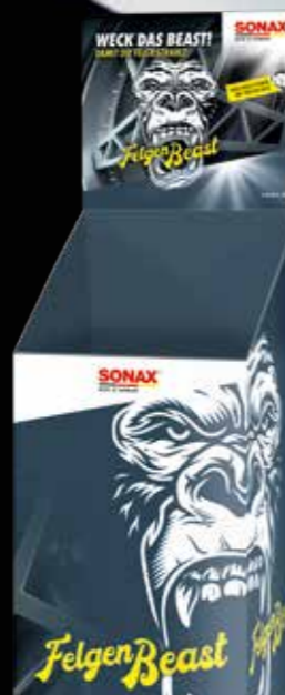
BODENDISPLAY FELGENBEAST ART.-NR. 02194980