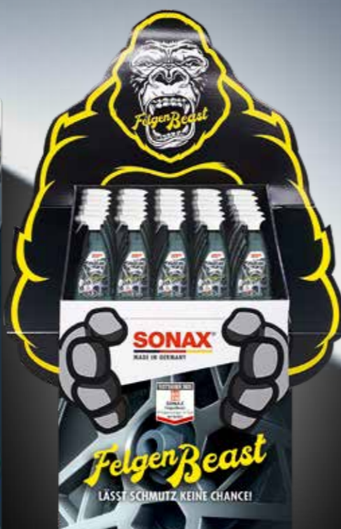
BODENDISPLAY FELGENBEAST ART.-NR. 02201980 (INKL. TOPPER)