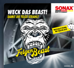
TOPPER FELGENBEAST ART.-NR. 02193980