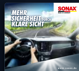
TOPPER KLARE SICHT ART.-NR. 02215980