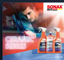
TOPPER CERAMIC SERIE ART.-NR. 02344980