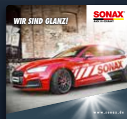
TOPPER NEUHEITEN ART.-NR. 02228980