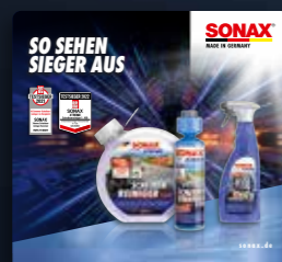
TOPPER XTREME SIEGER ART.-NR. 02197980