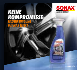
TOPPER XTREME FELGENTREINIGER ART.-NR. 02214980