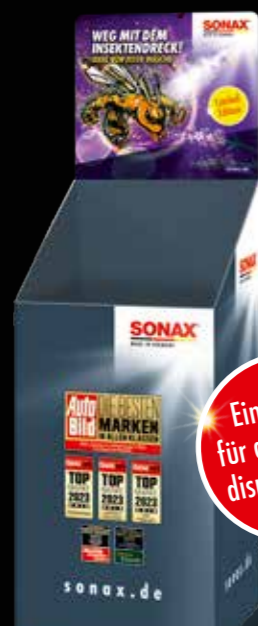
BODENDISPLAY NEUTRAL ART.-NR. 02198980