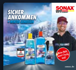
TOPPER WINTER ART.-NR. 02204980