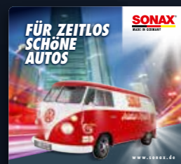
TOPPER BULLI ART.-NR. 02208980