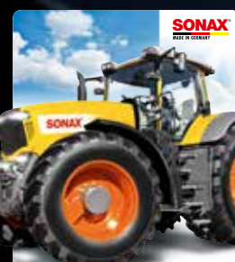
TOPPER AGRAR TRAKTOR (GESTANZT) ART.-NR. 02154980