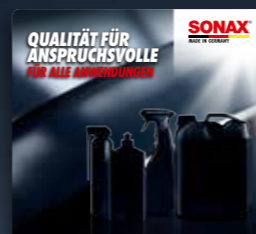
TOPPER NEUTRAL ART.-NR. 02128980