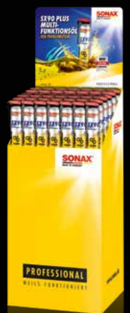
BODENDISPLAY SX90 ART.-NR. 02199980