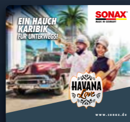
TOPPER HAVANA LOVE ART.-NR. 02200980